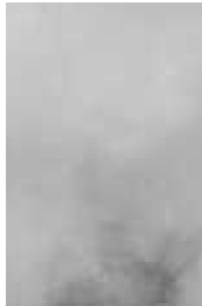
Onderschrift tag with 8 point dum-

"En 't is waar: een mens móét vernieuwen en blijven vernieuwen. Ook al is dat niet altijd gemakkelijk als ge al van 't jaar '40 dateert. Toch wil ik mezelf blijven corrigeren, mijn mening blijven bijstellen."